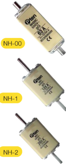
พิวส์ใบมิดรุ่น NH (Size 00,1,2)

Standard IEC 269-1,2,2-1 / Rated Voltage : 500V breaking / CSN 354701-1,2,2-1 / Capacity : 120KA / Din 43620 Rating / Current : 16 to 630A