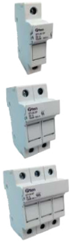
STI-32 Series ฟิวส์สวิตช์ RT-18 รุ่นไม่มีไฟ ใช้สำหรับลูกฟิวส์กระบอก ขนาด 10x38, 14x51, 22x58

Connection : cage terminals 10 mm. Protection degree : IP20