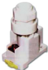
ฐานฟิวส์ E-16 รุ่นใส่ราง (E-16 Fuse Base-Din Rail Type)